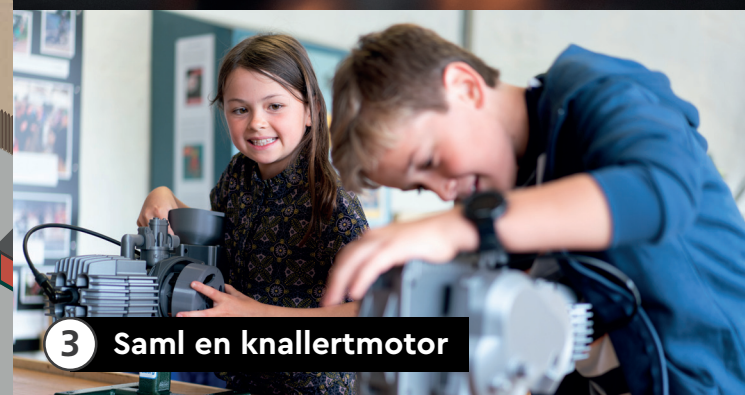
3 Saml en knallertmotor