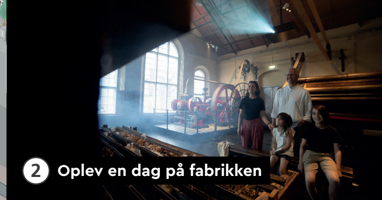
2 Oplev en dag på fabrikken