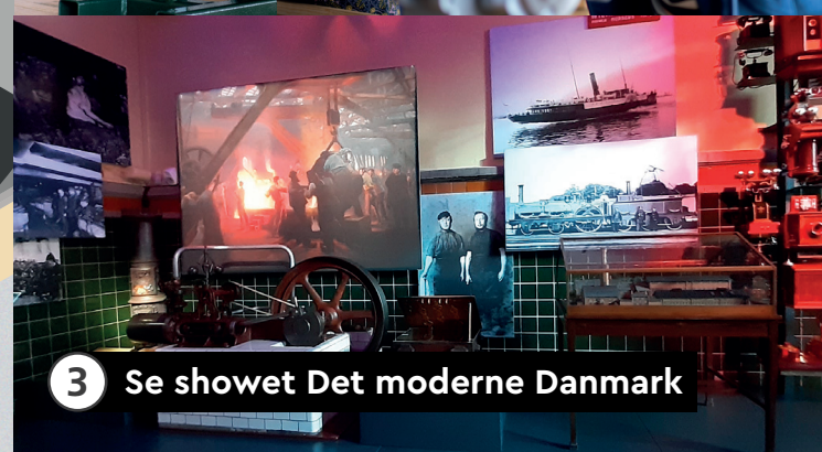
3 Se showet Det moderne Danmark