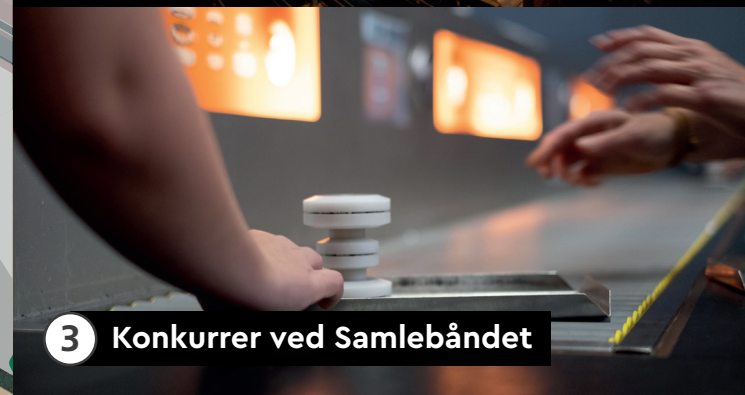
3 Konkurrer ved Samlebåndet