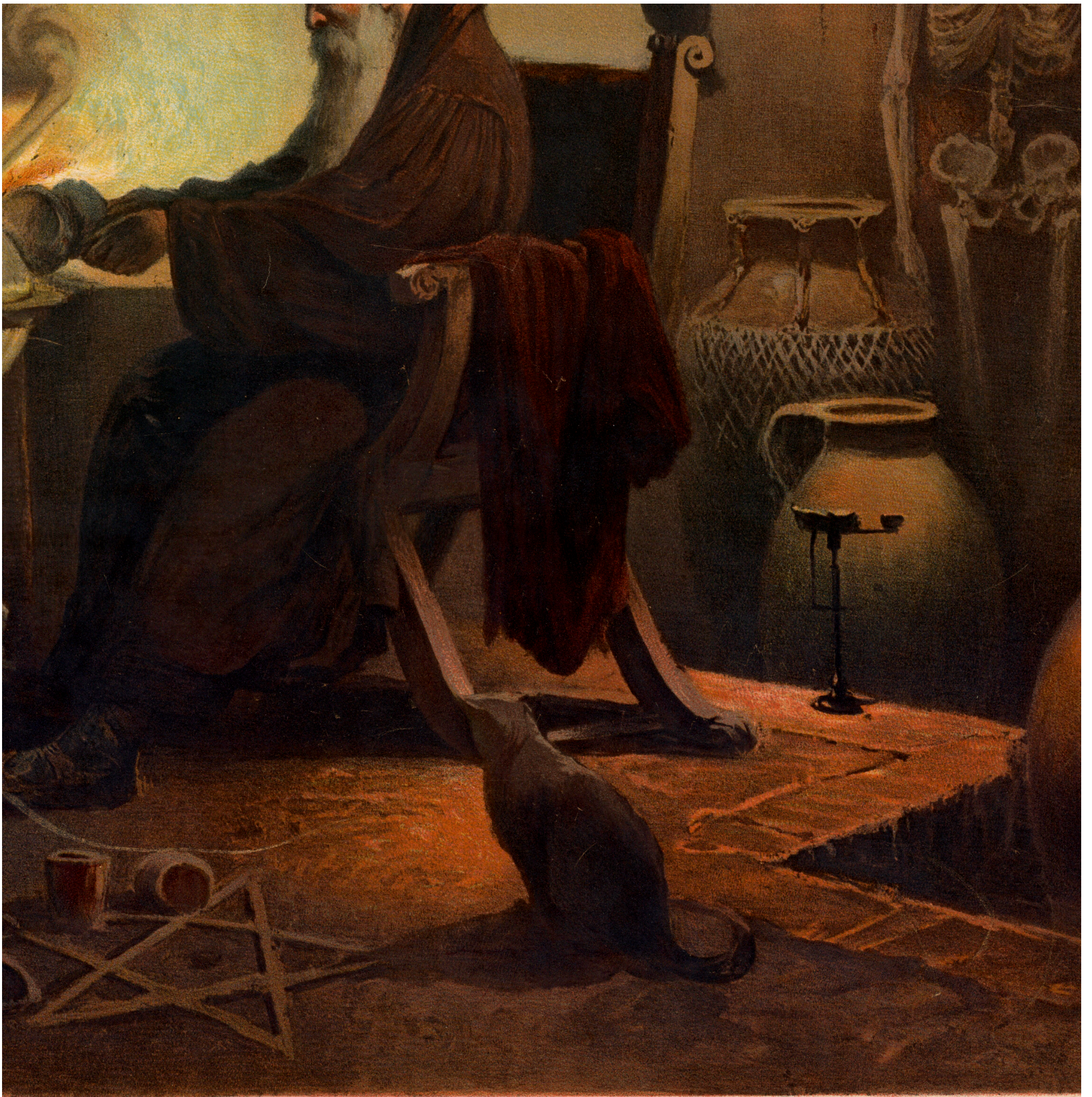
16 DER ALCHIMIST.