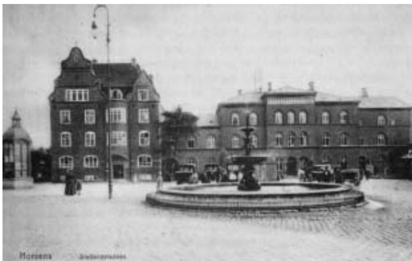
Den gamle stationsplads med Horsens første springvand. Foto fra omkring 1920.