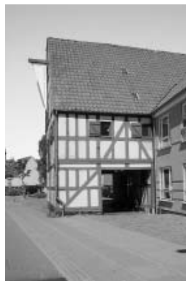
Pakhuset i dag set fra øst.

enden af Gasvej rundes de gamle spor efter Odderbanen og havnearbejdernes Varmestue (5) , som blev bygget i forbindelse med den "nye Toldbod", 1911-13.