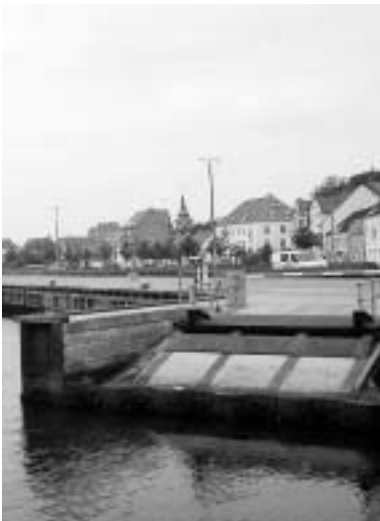
Færgelejet til Endelavefærgen med gamle toldbod i baggrunden.

Herfra kan man også kaste et blik ud mod øen (9) . Denne blev skabt ved en havneudvidelse i 1909, og her lå fra 1916 til 1930 Sejlklubbens klubhus. Pavillionen blev flyttet fra øen i 1930 til sin nuværende plads ude ved lystbådehavnen. Arkitekt var Viggo Norn, der også i 1906 tegnede byens elværk, de bygninger der i dag rummer Industrimuseet.