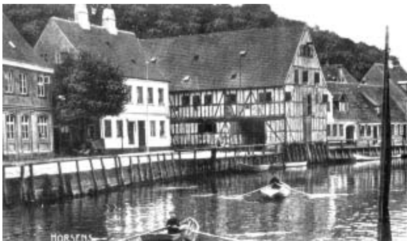
Den gamle åhavn før 1902 med pakbuset.

I modsætning til den gamle åhavns harmoniske proportioner, hvor pak-huse og boliger arkitektonisk var beslægtede, virker den nuværende havnebebyggelse noget rodet i sin udformning. Med "kajgaden" mellem vandet og bygningerne opleves havneområdet dog positivt rumdannende.