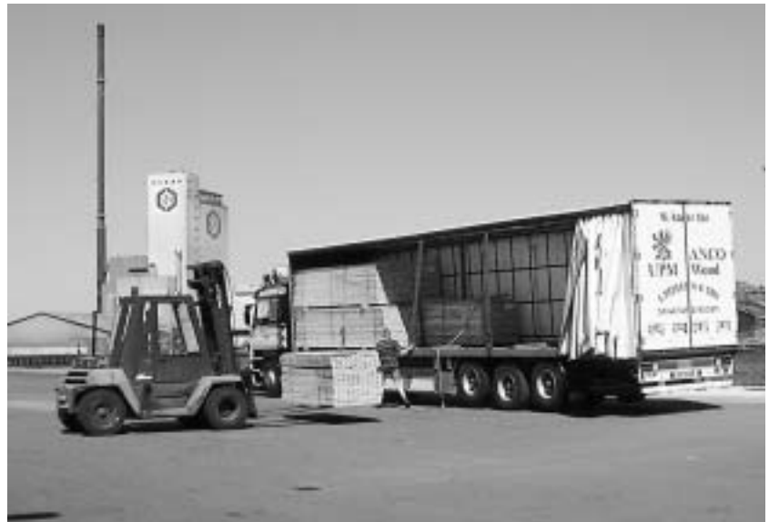
Omfattende transport af træ på Sydhavnen.