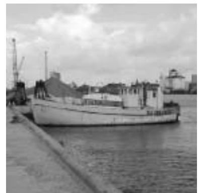
Nordsiden af ydre sydhavn.

Efter Havnemesterens kontor går turen tilbage langs kajen til inderhavnen, hvor Endelavefærgen (10) lægger til. Inderhavnen rundes, men i weekenderne og udenfor arbejdstid kan her være lukket for passage. Så må man udenom den første bebyggelse for at fortsætte langs den sydlige kaj - men pas på: Det er en arbejdsplads med daglig kørsel af kraner, trucks og lastbiler - forbi KFK ud til DFDS-Lands-transport (11) .