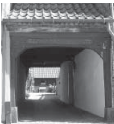
Læs evt. inskriptionen på portbygningen

den 85 (4) . Husene var placeret med gavlen ud til "åen", så det var muligt at hejse varer op ved hjælp af en kranbjælke, der ragede ud over vandet. Man ser tydeligt at havnegaden før opfyldningen af åen gik lige gennem huset.