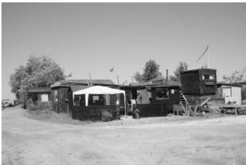
Gamle fiskerbuse på sydhavnen.