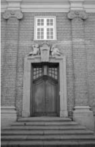
Indgangsparti til "Toldboden".

Ved Toldboden (6) , tegnet i nybarok stil af Hack Kampmann med granitarbejder, er der fint udsyn til den gamle toldbygning samt ind langs Åboulevarden. Fortsætter man i modsat retning, kommer man til Havnemesterens kontor (7) . Det ligger i det "Stykgodspakhus", som blev tegnet af arkitekt Viggo Norn og opført i 1914. En utrolig charmerende bygning.