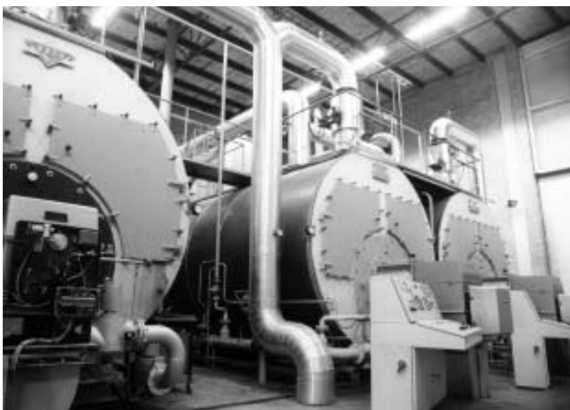
Højteknologi sørger for forbrændingen.