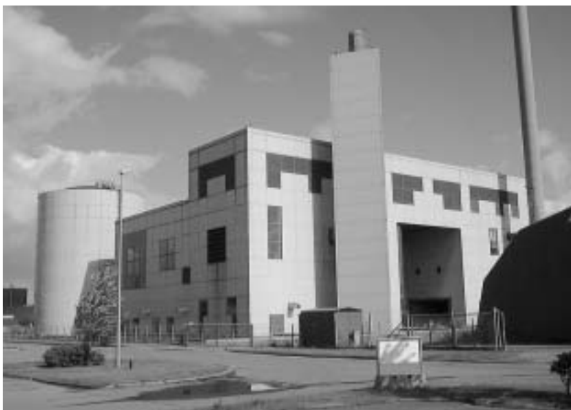
Et flot monument i rolige sandfarver.