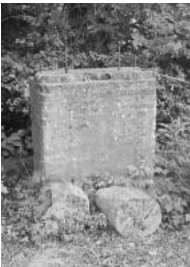
"Resten af teglværket".

Området lagde dog først navn til et teglværk: Hessellund Teglværk , som lå her fra omkring 1860 frem til 1948. På højre hånd ses en lille rød bygning med græsbeget tag. Det var teglværksarbejdernes frokoststue (5) . Efter opførelsen af en stor ringovn i 1905 blev virksomheden et af de industrialiserede anlæg, som sammen med Byholm Teglværk udkonkur-