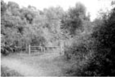
Følg denne vej.

Lidt længere fremme ses to bomme (4) som passerer og man kommer ind på Hessellund. Vejen har sit navn efter, at der i området tidligere har eksisteret en lund af hasseltræer og buske.