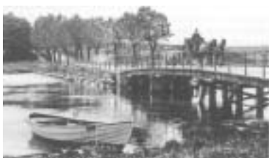
Den første vejbro over Stensballe Sund.

Turen fortsætter over Sundbroen. På højre hånd ligger teglværkets tidligere direktørbolig fra 1910 Hessellund nr. 1 med sit gavltreief, der viser en murstrøge sten.