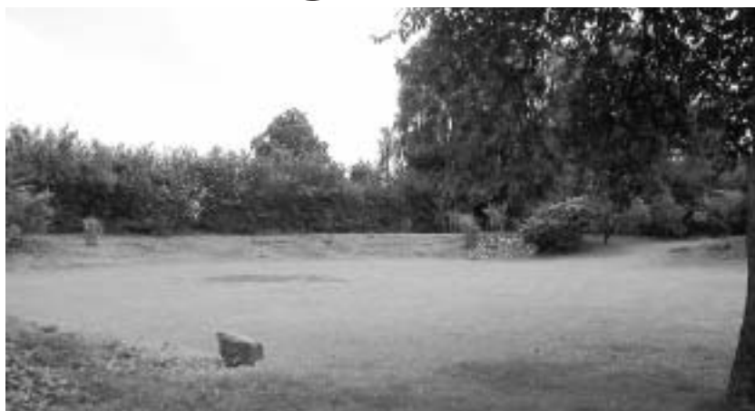
Her ses konturerne af den tidligere cykelbane i haven bag Sølyst.