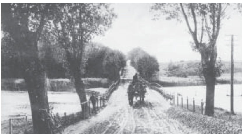
Sundbroen set fra øst 1910