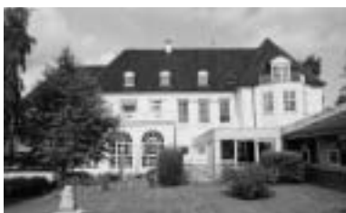
Sølyst set fra haven.

stilling. Horsens havde på det tidspunkt 18000 indbyggere. Banen var 400 meter lang og op til 7 meter bred. I 1902 tages banen også i brug til motorcykelløb, men en tiltrængt reparation i 1904 opgives, og banen nedlægges. For enden af vejen ud mod Sundvej ligger Sølyst (2) . Siden sin opførelse i 1877 har bygningen ført en omskiftelig tilværelse. Den tjente blandt andet som traktørsted, og var som sådan uundværlig i forbindelse med cykelbanen. Ejendommen blev i 1912 solgt til telefonfabrikant Emil Møller, "Bastian", der lod Sølyst ombygge til sommervilla. Det var den kendte horsensarkitekt Viggo Norn, der stod for ombygningen. Der blev tilføjet førstesal, og tårnet udstyredes med en kobberkuppel. Horsens fik hermed sin første virkelige herskabsbolig.