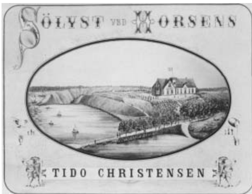
Sølyst som stedet oprindeligt så ud. Bygningen blev opført som traktørsted i 1877.