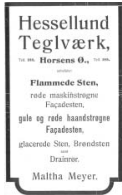
Helsidesannonce i Horsens Vejviser 1909 og 1910.

rerede de mange små teglværker omkring byen (Hammersholm, teglgården i Sundmarken m.fl.). Leret blev hentet på begge sider af Sundet, og værket anlagde sin egen bro og senere svævebane til transport fra - de tidligere nævnte - udgravninger på vestsiden af Sundet. Vi fortsætter på den tidligere teglvæksgrund ad Hessellund til Oddervej. Man kan evt. vælge at gå hen til enden af Karensvej, hvor man til venstre finder resterne af fundamentet til en af teglværkets røremaskiner (6) .