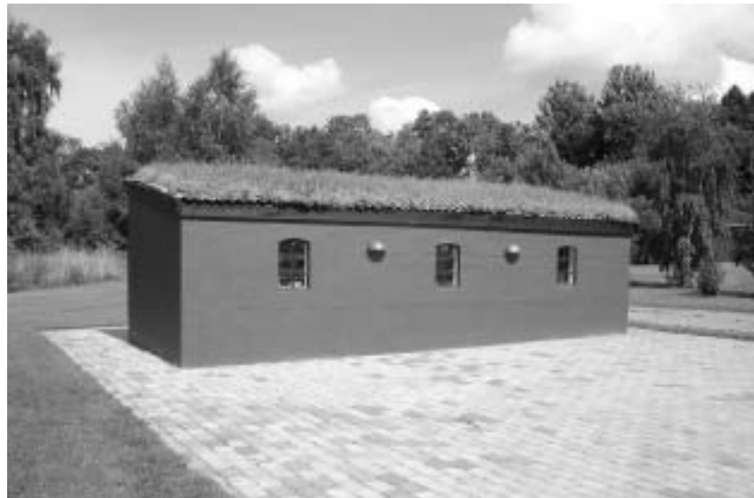
Teglværksarbejdernes tidligere frokoststue.