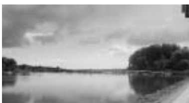
Odderbanen eksisterede 1905 - 1966.