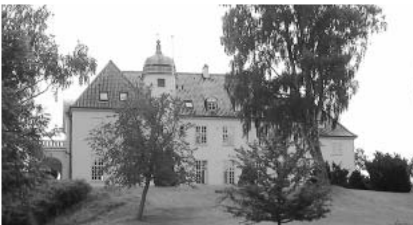
Sølyst fungerer i dag som behandlingshjem.