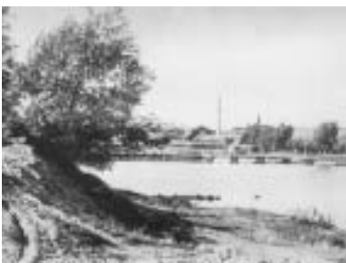
Hessellund Teglværk, der anes bag Sundbroen. (1925)

Lidt længere fremme ses to bomme (4) som passerer og man kommer ind på Hessellund. Vejen har sit navn efter, at der i området tidligere har eksisteret en lund af hasseltræer og buske.