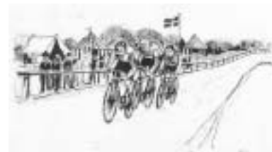
Cykelbanen ved Sølyst var et populært og muntert sted - med 8 totalisatorer - ved århundredskiftet.

Følg vejen fra parkeringspladsen (1) langs Sundet mod broen. På venstre side af vejen ser man nogle høje skrænter med bebyggelse. Det var umiddelbart bag disse skrænter Horsens engang havde en cykel-bane. Resterne heraf findes stadig i haven bag Sølyst - der er dog ikke offentlig adgang. Det var den 2. august 1896 provinsens første cementcykelbane: Dansk Cykle- Rings Væddeløbsbane blev indviet. Det blev noget af et tilløbsstykke. Der kom ca. 4000 tilskuere til den 4 timer lange fore-