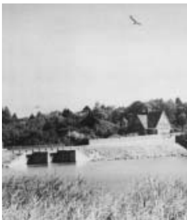
Slusen under broen med den tidligere teglværksbolig til højre.

Turen fortsætter over Sundbroen. På højre hånd ligger teglværkets tidligere direktørbolig fra 1910 Hessellund nr. 1 med sit gavltreief, der viser en murstrøge sten.